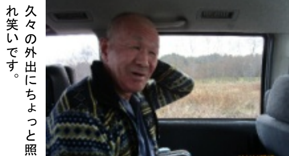
久々の外出にちよつと照れ笑いです。