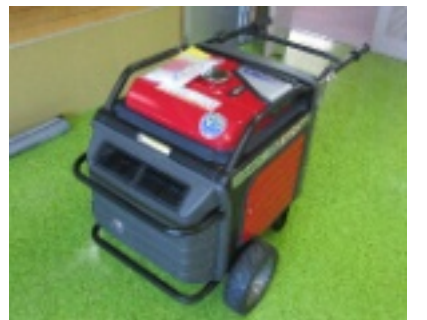
今回納入された発電機。移動も楽に行えるようになっていきます。

心と園の非常用発電機は今回の納入により4台、また投光器が2台となりまして。昨年9月の胆振東部沖地震に伴う、北海道全域の停電は記憶に新しいところですが。心と園では施設の非常災害対策計画のもと、非常災害時の体制整備を今後も継続して行っていく予定です。