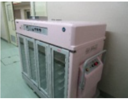
温冷配膳車のうちの1台（多床室）

温冷配膳車は保温の他に保冷も同時にできるので、用意した食事が温かいものは温かいまま、冷たいものは冷たい状態でご用意できるようになっている配膳車です。