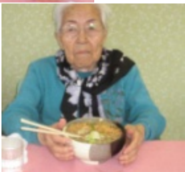
毎月の楽しみにしているとうれしい言葉をいただきました。