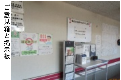
ご意見箱と掲示板

面会など、ご来園の際には「ご意見・ご要望を気軽に」お寄せください。また「ご意見・ご要望」は定期的に当スペース