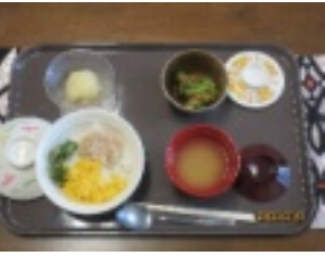
新食器と説明会の様子