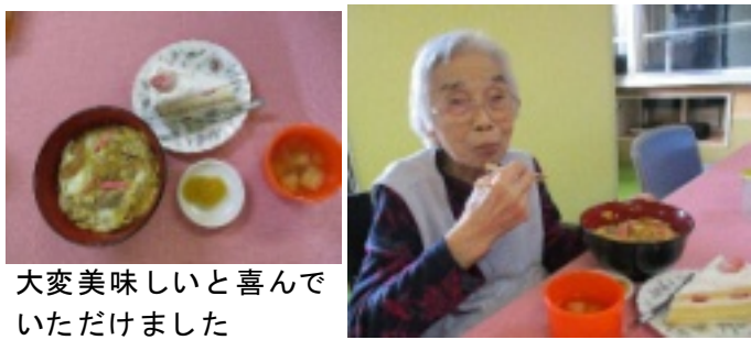
大変美味しいと喜んでいただきました

11月19日(火)に千葉様となりました。様の誕生会が行われ、親子丼の他に、ケーキも一緒に用意しました。担当職員が本人様に何かお祝いに食べたいものはと尋ねたところ、『親子丼が食べたい』との希望がありました。当初は町内の食堂へ外出してお食事をご考えていましたが、インフルエンザの町内発生報告もあったことから、今回は出前での祝い 親子丼の他に、ケーキも一緒に用意しました。職員もお祝いに駆けつけると、大変喜んでくださいました。食事も美味しくいただきながら、昔話を中心としてお話をいっぱい聞かせていただきました。今度は是非、温かい時期にお店にお食事に行きたいですね。