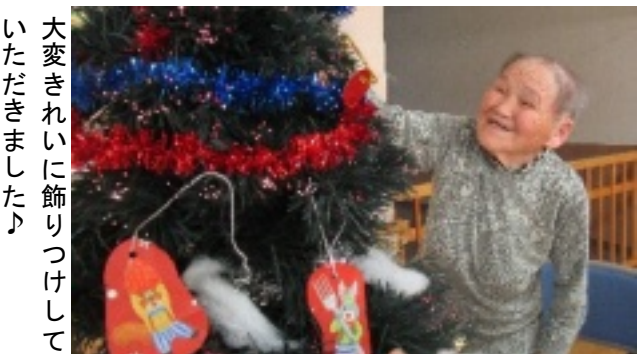
大変きれいに飾りつけしていただきました♪