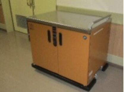
温冷カートのうちの1台（ユニット）

入居者の皆様、食器が新しくなったことにも大変喜ばれています。食事は実際の美味しさとともに、目でみる楽しさでもまた大変なことです。