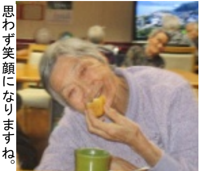
思わず笑顔になりますね。