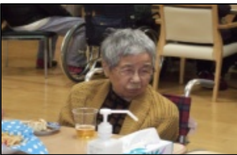
思わず笑顔がこぼれます。

はユニットでは初めての試みとなった行事でした。今後も入居者様に楽しんでいただける行事を企画していきたいと考えています。是非ご家族様の参加もお待ちしております。