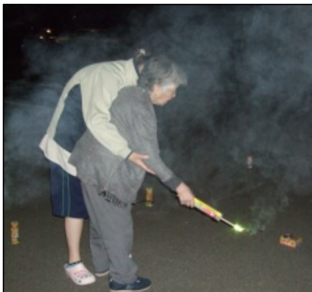
花火には自然と拍手が沸き起こりました。