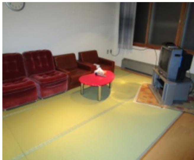
畳が新しくなったくつろぎスペース

心と園多床室のホール横に用意しているくつろぎスペースの畳がこの度新しくなりました。長年使用してきた畳のため、痛みも目立つようになっておりましたが、今回新しく張り替え、和室の雰囲気のスペースができてきました。テレビの他、カラオケも設置されておりますので、入居者様が日中にくつろぎながら楽しく談笑したり、歌を楽しんで過ごす場所として今後も活用していきたいと考えています。きれいになった畳に入居者様も大変喜ばれて過ごされています。