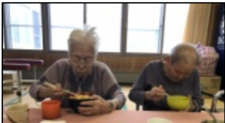
お蕎麦、美味しいですね。皆さん完食でした。

8月23日は出前の日。今回もお蕎麦の出前に皆様舌鼓をうたれていました。町内東屋様には今回も出前のご協力をいただいています。この場を借りてお礼申し上げます。 「また食べたいね。」と参加された皆様大変喜ばれておりました。