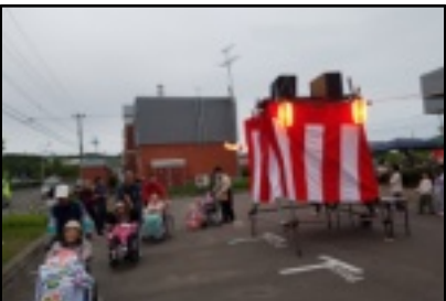
盆踊り参加時の様子

8月には町内自治会の皆様より夏祭りには是非参加してくださいとお誘いをいただき、心と園の入居者様も参加させていただきました。8月3日には山の手自治会の夏祭りに参加入居者様6名が参加。緑日や出店でのラーメンやおでんを食べたりと楽しく過ごさせていただきました。8月4日は宮園鉄北自治会の夏祭りに入居者様5名が参加。ドライブがてらコンキリエにてソフトクリームも食べてきました。8月10日には白浜自治会の夏祭りに5名の入居者様が参加。盆踊りにも上手に踊られていました。 自治会の皆様のご協力もあり、心と園の入居者様が地域の皆様と触れ合う機会をいただきました。心と園では今後も、地域の皆様との交流を図る行事への参加、企画を考えています。住み慣れた厚岸町の地域の皆様との結びつきを実感できる機会を入居者様の少しでも用意したいと職員一同も考えております。 夏祭りに関しましては是非来年度も参加の機会をいただければと思います。自治会の皆様も他来場されたご家族様にも重ねてお礼申し上げます。