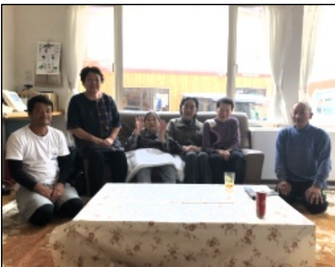
ご自宅にてご家族様と