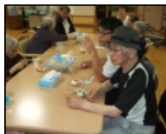
おつまみもすすみます

トロピカルジュースなどをご用意しました。またおつまみやおやつ類なども用意され、皆さん会話も弾み楽しいひとときとなりました。 余興としての花火も行われました。設置型花火のほか、手持ち花火も楽しまれ、夏を感じる催しとなったようです。 今回のビアパーティー