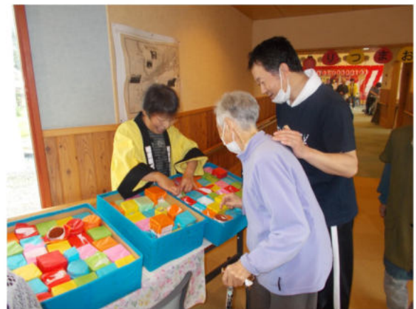
[上]お楽しみのお宝くじ。宝はどこに入っているのかな？

音楽演奏だけでなく、メンバーによるレクリエーション指導もあり、アルファベットの「B」のかたちをした大きなチューブを使う3B体操に初挑戦。みなさん楽しく取り組みました。