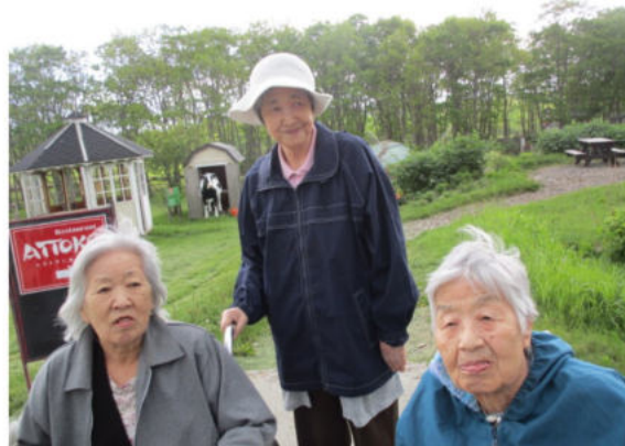
[右]心和園の皆様が外出。厚床の伊藤牧場で一枚。