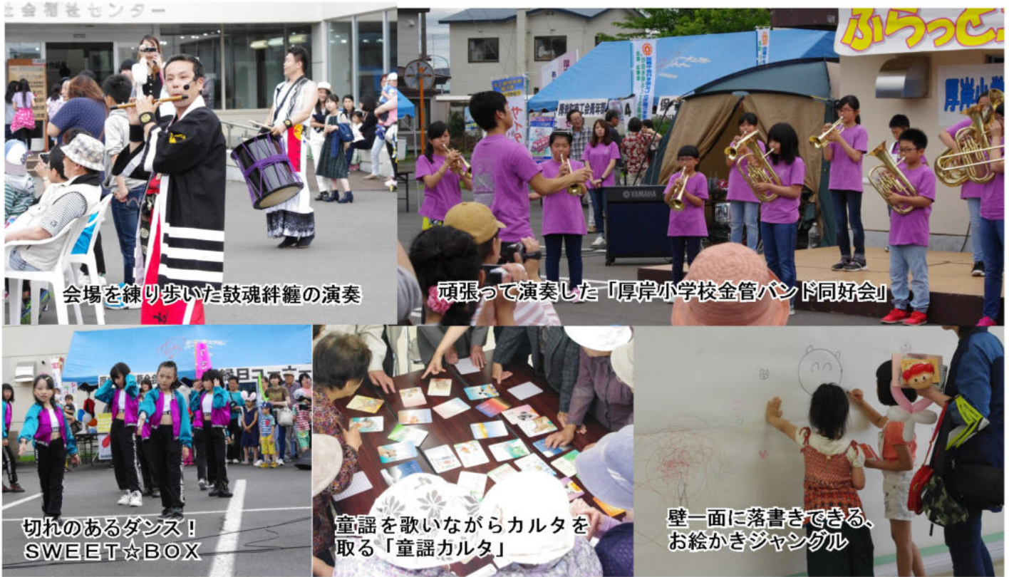
会場を練り歩いた鼓魂絆纏の演奏