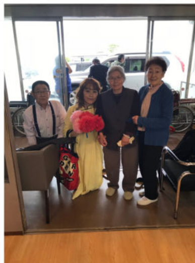
[上]おやじバンドの皆さんと