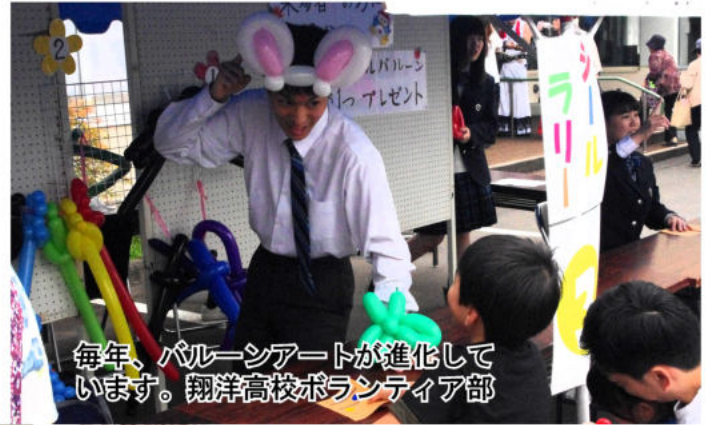
毎年、パルーンアートが進化しています。翔洋高校ボランティア部

今年は去る、7月22日（日）社会福祉センター駐車場で開催しました。前日までは雨予報で屋内開催の心配もありましたが、当日は天気も味方し、最後まで屋外で開催ができ、盛会のまま終了しました。