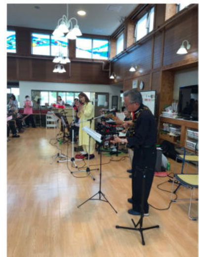
[上]会場みんなで口ずさむ