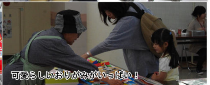
可愛いおりがみがいっぱい！

今回の新企画は「消防署のけむり体験」や釧路ヤクルト販売の「スキンケア体験」、厚岸町商工会青年部による「あつけしのサイダー」販売などで、今年は様々な方の協力により、より一層の盛り上がりを見せました。また、毎年出店している町内障がい事業所は、新メニューの提供もあり、各ブースが賑わっていました。ここからは、当日の様子を写真で紹介します。