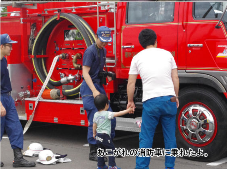
あこがれの消防車に乗れたよ。