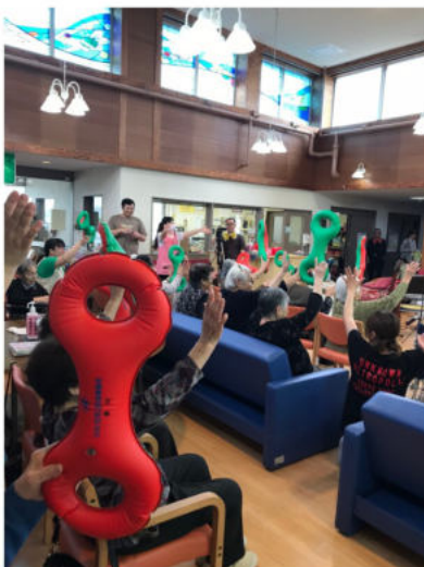
[上]3B体操は大盛り上がり！