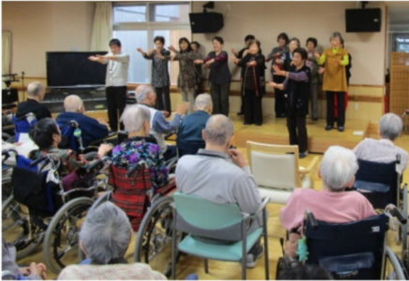
[左]一円玉の旅がらすを口ずさみながら、厚岸町老人クラブ連合会女性部と一緒に手踊りをする心和園の皆様。