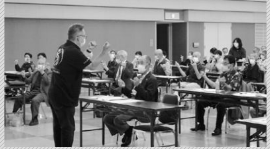
出す指によっては難しい！指体操

研修では、認知機能の予防をテーマに、指を使った健康体操や間違い探しなどの脳トレを行い、終始会場は笑いで包まれました。講師は、「できた・できないという結果よりも、チャレンジする気持ちが大切だ」と参加者に力強く伝え閉会しました。