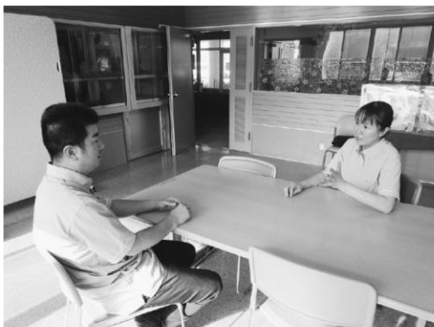
（上）主任とリーダーの打合せ風景