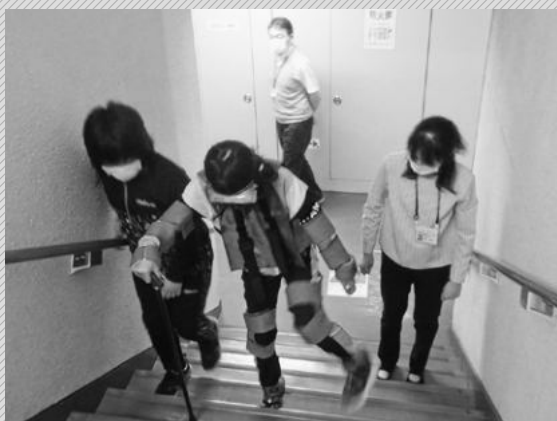
危険がないように声かけが必要です

6月28日、厚岸小学校5年に「福祉学習」の一環として『高齢者疑似体験』の出前講座を行いました。