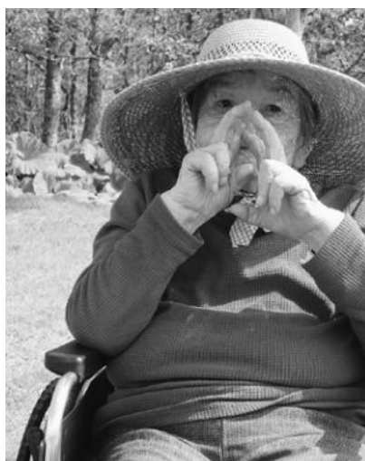
（上）太陽の温かさを感じられる外出は気持ちいいですね

今後もさらに入居者皆さんの好みを取り入れながら、日々の楽しみを少しでも増やしていけるお手伝いをさせていただけたらと考えています。（遠藤主任）