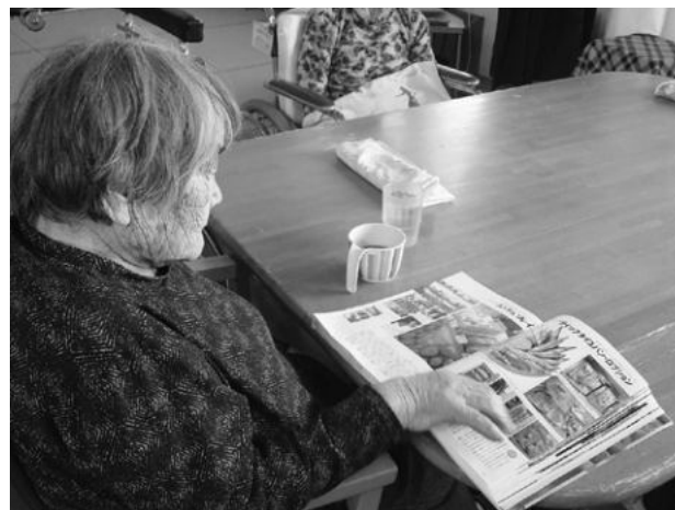
（上）余暇活動として読書を楽しんでいます

新型コロナウイルスワクチン接種状況など、現在のコロナ対策についてお知らせします。