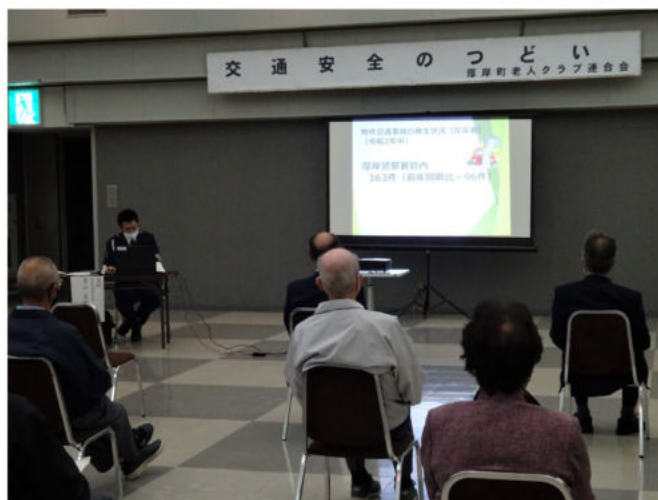
高齢者が運転する交通事故の特徴について説明を受ける参加者

参加者は、普段から自身の運転で前方不注意や走行速度に注意し、『かもしれない運転』を意識することを誓いました。