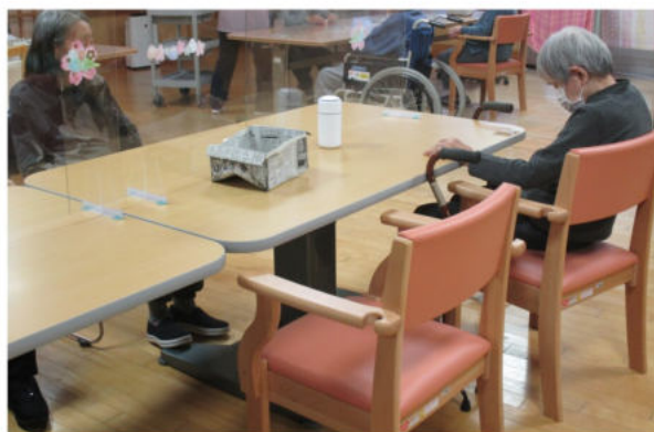
新しいので気持ちがいいし、肘掛けが付いているので楽に座り続けられます。

これは、施設生活を快適に過ごせるよう、老朽化したテーブル等の入れ替えを厚岸町に依頼し実現したものです。入居者の皆さんが、長く時間を過ごすホールに設置しました。