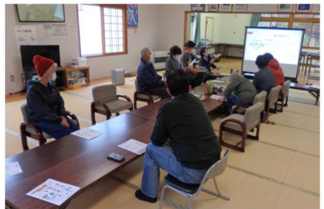
真剣に話に耳を傾ける聞く参加者の皆さん