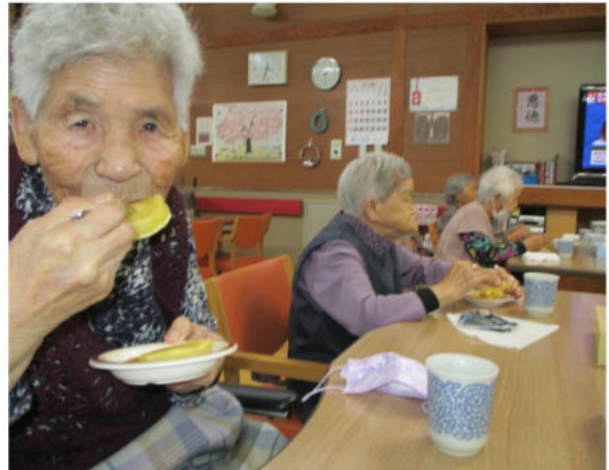
いもだんごおいしいね。カメラに向かっていただきます。