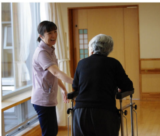
和やかな雰囲気で行う歩行運動。

ユニットフロアとは、入居者や介護スタッフと共同生活をしながら、1人1人の個性や生活リズムに合った生活が送れるよう、全室個室の施設のことをいいます。心和園には、南北2つのフロアに18名が入居しています。