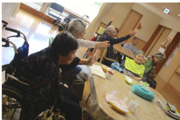
交流スペースでは、入居者とスタッフで体操をして過ごすことも。

日中の過ごし方は、自宅の生活と同じ様に、リビングでテレビや新聞を見る方、部屋でゆっくり編み物などをする方、職員のウエス作りを手伝ってくれる方など様々です。