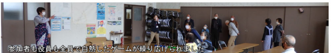
参加者も役員も全員で白熱したゲームが繰り広げられました

久しぶりに交流事業をやるから、レクリエーションをやってもらえないかと話があり、二つ返事で集会所へ向かったのは10月中旬のこと。