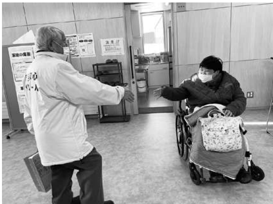
鶴居村分会会長と久々の再会を果たしいい笑顔がみられました。

楽しみ、釧路市立美術館で抽象画を鑑賞しました。終始笑いが絶えない会員さんたちに、事務局はいつも元気をもらっています!