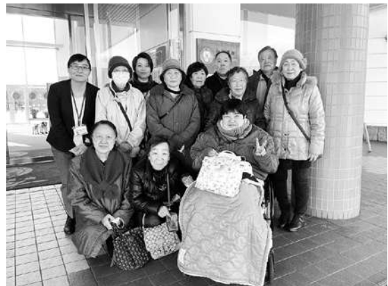
山花温泉リフレにて記念撮影。両日とも晴天に恵まれました!