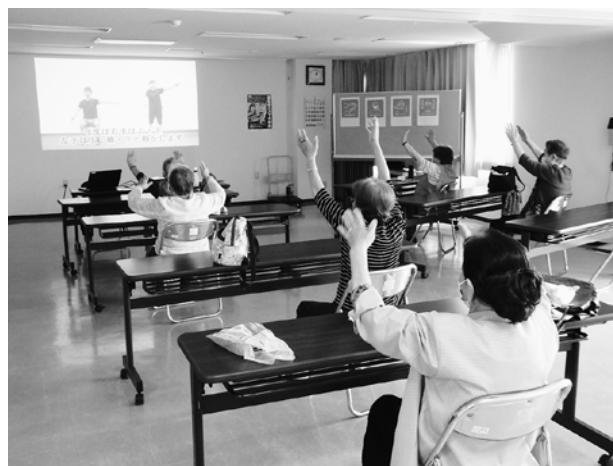
介護予防体操「厚岸音頭で介護予防」のDVDに合わせて身体を動かす参加者

この日は、脳のトレーニングと介護予防体操を行い、参加者は「久しぶりにみんなと会って話をしたり会食ができて良かった」「家にいる時間が多く外出する機会が減っていたから、身体を動かすことができて良かった。」と喜んでいました。