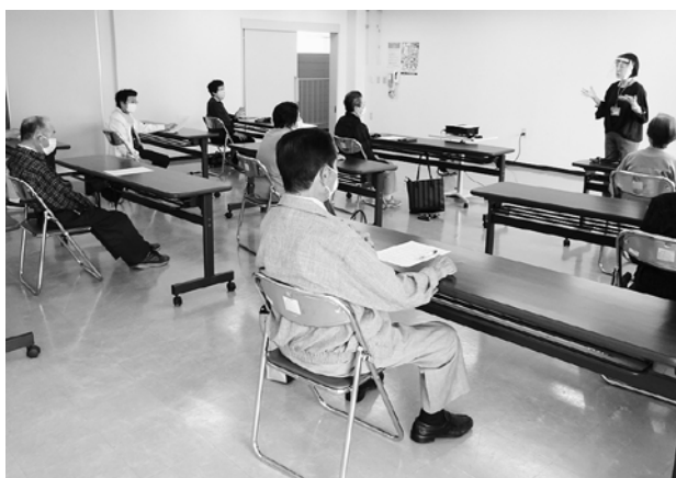
保健師の話に、真剣に聞き入る参加者たち